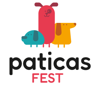
Camiseta Oficial del Evento